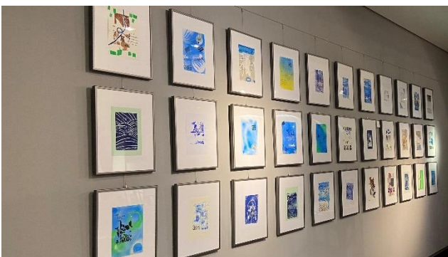
Druckwerke von Schülerinnen und Schülern in der Ausstellung future is liquid .