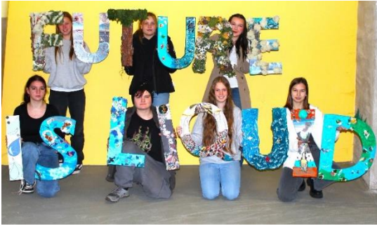
Schülerinnen der Städtischen Realschule Bad Münstereifel fertigten die Buchstaben future is liquid .